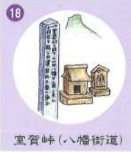
18 室賀峠(ハチロジ街道)