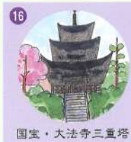
16 国宝・大法寺三重塔