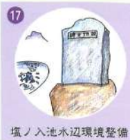
17 堀ノ入池水辺環境整備